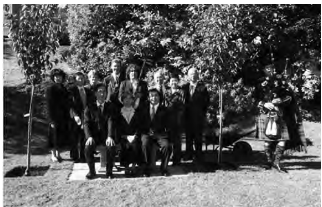
寄贈したベンチと桜の植樹（両側）

2006年に日本からの寄贈により建立されたバルトン記念碑からバルトンが幼少期を過ごしたオールド・クレイグハウスを挟む小高い丘の中腹にベンチは設置された。ベ