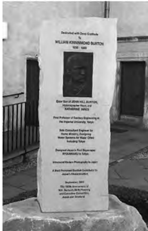
W・K・バルトン記念碑