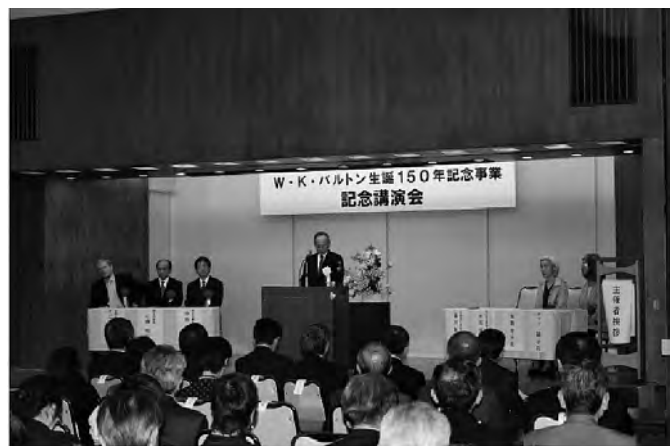
W・K・バルトン生誕 150 年記念式

2006 年 5 月 13 日、東京都庭園美術館新館大ホールにて、「W・K・バルトン生誕 150 年記念式および講演会」を開催した。参加者は約 230 名であった。第 1 部記念式では、厚生労働大臣(代)、国土交通大臣(代)、英国大使館ダニエル・ソルター氏、バルトンの曾孫である鳥海幸子氏、同メッツ・陽子氏の挨拶があり、デビッド・パトン氏からのメッセージが読み上げられた。その後、藤田賢二実行委員長が「わが国衛生工学の始祖バルトン」と題して基調講演を行い、バルトン先生の経歴、功績などについて紹介された。