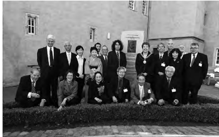
記念碑前にて英国協力委員と日本側団員

関係の資料のコピーおよびこの記念事業に賛同され、寄付を寄せられた方々のお名前を記した名簿をタイムカプセルとして収納した。これが再び開かれるのはいつのことか、開かれたときの人々の表情を想像すると、何か楽しくなってはこないだろうか。